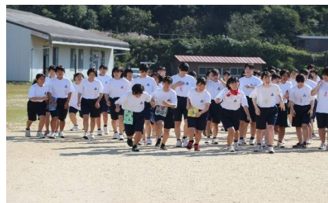
女子折り返し地点の様子