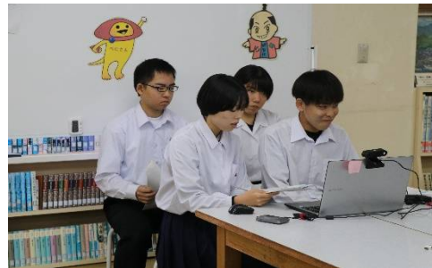
生徒による学校生活紹介