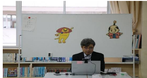
校長先生開会の挨拶