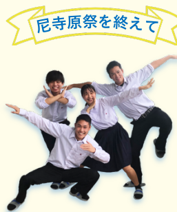
令和3年度前期 生徒会執行部 四役のみなさん

天候不良で体育祭も延期となり、不安と期待が入り混じる尼寺原祭でしたが、青春を謳歌した最高の思い出となりました。尼寺原祭の開催を支えてくださった全ての人に感謝を忘れず、この経験を今後活かしていきます。